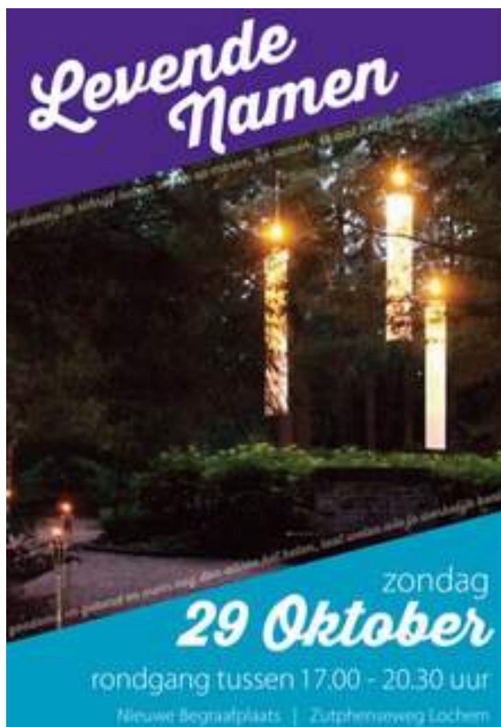
Affiche 2017 (Ontwerp: Mo Middag, @2017)