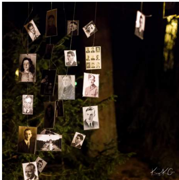
Oorlogsslachtoffers (concept: Albert Baarsen)

Langs het Strooiveld voor de lichtbollen richting 'Tussen hemel en aarde' weer terug naar de uitgang waar scouts achter de 8 oorlogsgraven stonden. Bij prachtig verlichte zwart-wit foto's van oorlogsslachtoffers mochten de bezoekers hen herdenken.