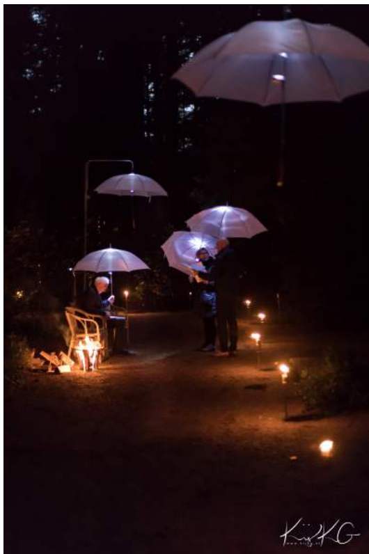
Het 'Gedichtenlaantje' bij avond

Hierna kon men de route vervolgen langs het mooie en en altijd bijzondere 'Gedichtenlaantje'. Onder witte paraplu's droegen vrijwilligers weer passende gedichten voor.