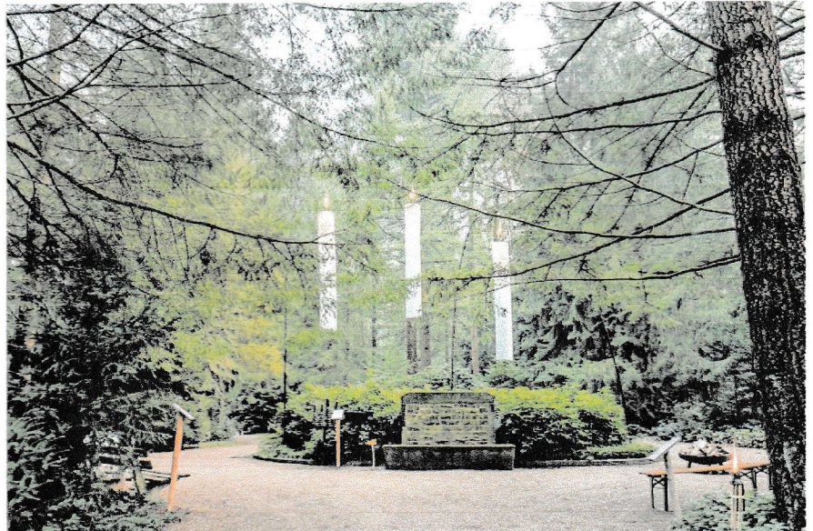
Op de nieuwe begraafplaats in Lochem bestaat op 29 oktober de mogelijkheid om dierbare overledenen te herdenken.

mee met een lichtje. Al snel komen deelnemers bij het onderdeel waarbij de naam van de overledene in het zand wordt geschreven. Een lichtbak onder het zand geeft de naam extra nadruk. Dit onderdeel is ook voor kinderen erg geschikt.“ Vier koren waaronder gelegenheidsformatie Le-